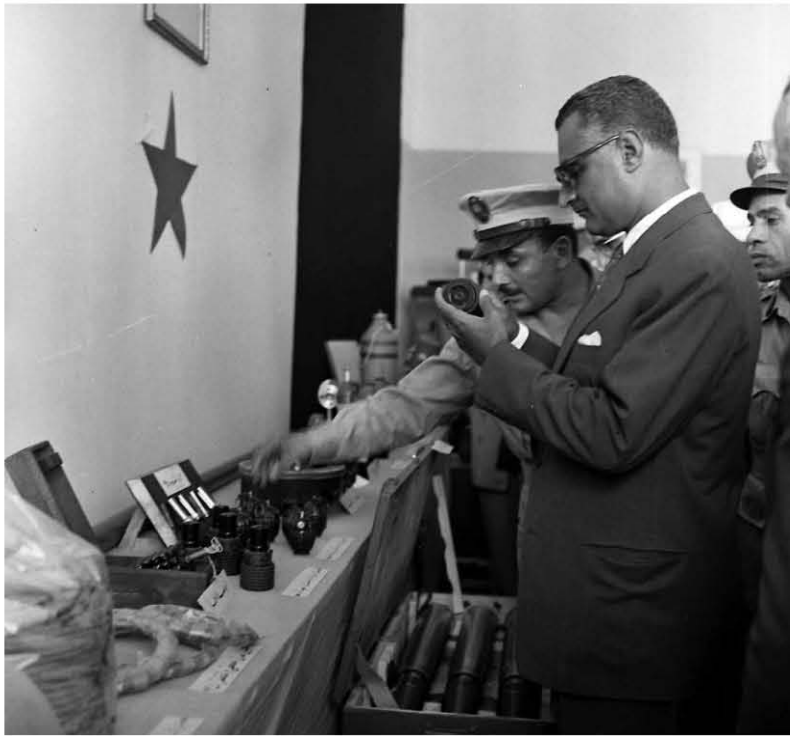
عبد الناصر يشهد الإنتاج الأول لمصنع الذخيرة الثقيلة بحلوان ١٩٥٨/٩/٤

مؤسس هذه الشركة: ٢٠٠ مساهم من شبرا الخيمة.